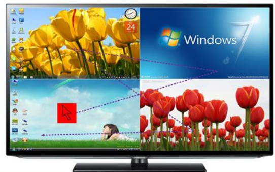
Normal clockwise or counterclockwise crossing