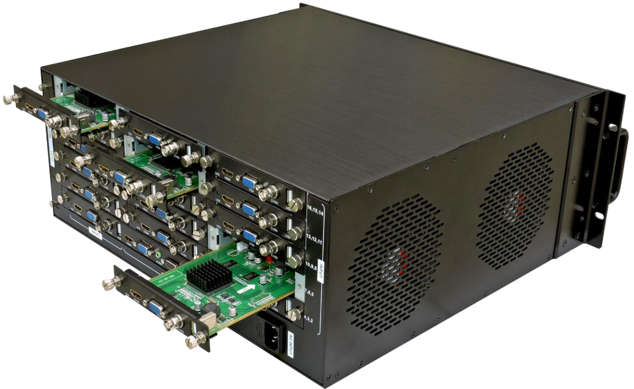
插卡式机箱实物图片

产品长年使用过程中可能某些模块先老化而出现故障，以往非模块化设计的产品在出现质量问题时往往需要把整个机箱返厂维修，这样不但产生高昂的运费，而且给用户造成很多时间上的浪费。而使用插卡式的设备只需要把板卡模块寄给用户即可很快解决问题。并且单独模块出现问题，可以不影响其它模块的正常工作。