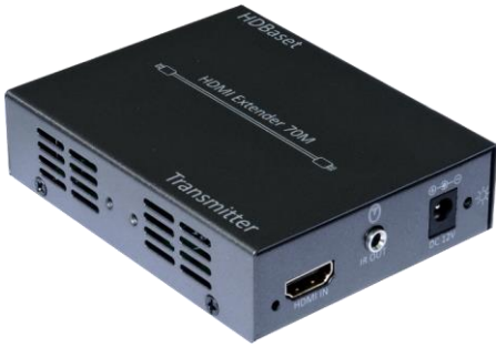
发送端 A 面