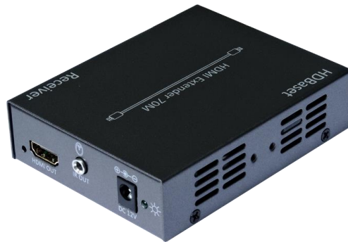
接收端 B 面