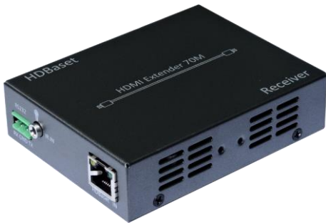
接收端 A 面