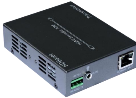
发送端 B 面